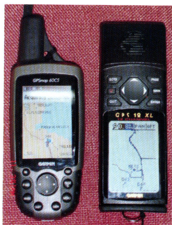
Contoh peralatan GPS yang dapat di gunakan

protected code (P) dan coarse/acquisition code (C/A). Tujuan utama dari kode-kode signal ini adalah untuk menghitung waktu perjalanan ( travel time ) dari satelit ke GPS di permukaan bumi. Travel time ini juga dikenal sebagai waktu kedatangan ( time of arrival ). Kode-kode ini juga memungkinkan pesan-pesan navigasi dari satelit diterima oleh GPS.